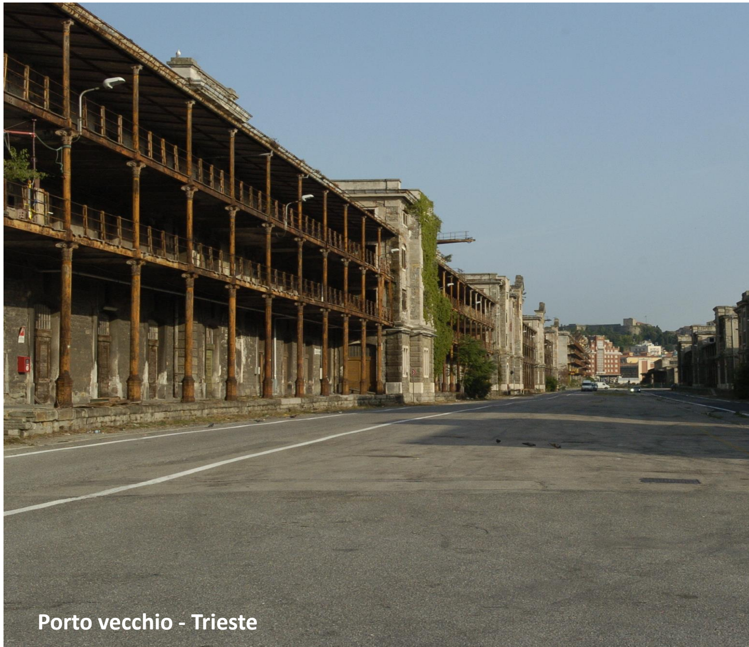
Porto vecchio - Trieste