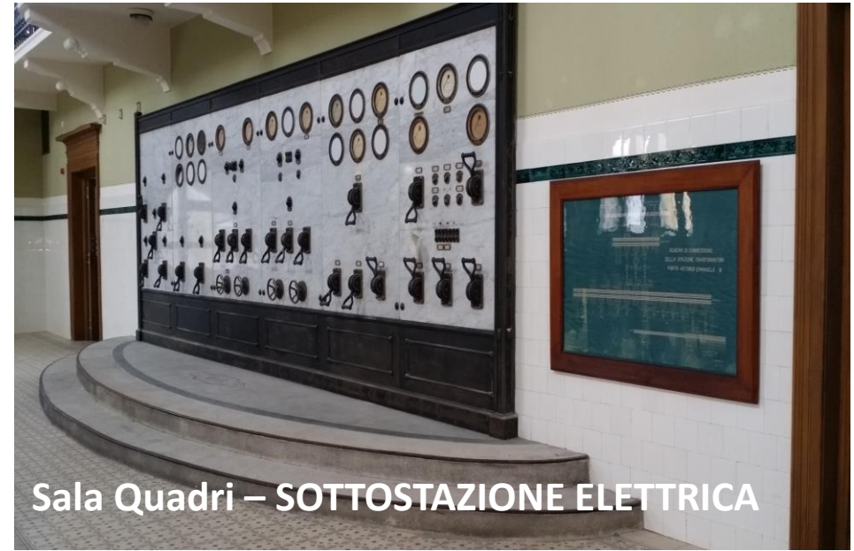
Sala Quadri – SOTTOSTAZIONE ELETTRICA